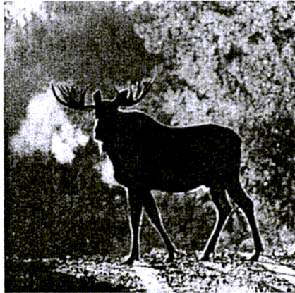
Der größte aller Hirsche ist der Elch, der von der Schutzgemeinschaft Deutsches Wild zum Tier des Jahres 2007 gewählt wurde.