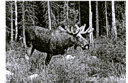
Auch in deutschen Wäldern ist der Elch nun wieder zuhause. Er wird immer häufiger in Brandenburg, Mecklenburg, Sachsen und sogar in Bayern beobachtet.

Arten, die nun wieder Heimatrecht in Deutschland haben. Der „grimme Schelch“ des Nibelungenliedes ist die größte Hirschart, die auf Erden existiert. Zur Wiederkehr des Elches erklärte der Präsident des Bundesamtes für Naturschutz, Hartmut Vogtman: „Wir halten eine dauerhafte Etablierung für durchaus realistisch, weil diese Regionen ausreichend groß und gewässerreich genug sind und große verkehrsarme Räume haben, die der Elch braucht“.