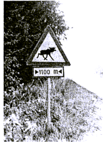
Vielleicht wird dieses Verkehrszeichen nicht nur in Schweden sondern auch an deutschen Straßen stehen, denn Elche gibt es nun auch wieder in Deutschland.

In Deutschland gab es den Elch nach Kriegsende und dem Verlust Ostpreußens nicht mehr. Nur etwa 1200 der zuvor nach Tausenden zählenden ostpreußischen Großhirsche konnten die Kriegswirren überleben. Ihre Zahl ist nun wieder höher, da die russische Verwaltung den Elch